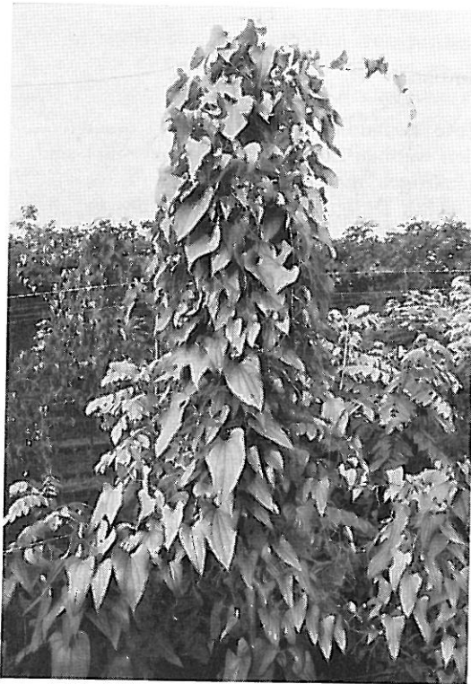
Abb. 1. Mehrjährige Pflanze von Dioscorea composita .

und diese werden deshalb unter dem Namen Barbasco als Fischgifte verwendet. Verschiedene steroidfreie Arten werden in den Tropen seit langem als Kulturpflanzen angebaut und dienen als Kartoffelersatz. Man darf sie jedoch nicht mit der Süßkartoffel Ipomoea batatas verwechseln, die zu den Windengewächsen gehört.