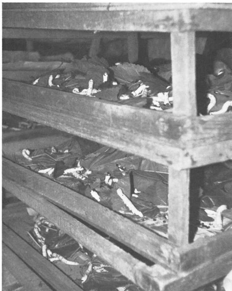
Abb. 3. Auf einfachen Holzgestellen werden die Raupen mit Blättern des Maulbeerbaumes gefüttert.

Je nach Boden- und Klimaverhältnissen sind in Korea ein bis drei Kokernten pro Jahr möglich. Alle Familienmitglieder werden in der Pflege der Maulbeerbaumanlagen, beim Blätterpflücken und Füttern der Raupen eingesetzt. Das Raupenstadium dauert mit den Häutungen etwa vier Wochen. Am Ende dieser Zeit werden die Verpuppungsrahmen aufgestellt,