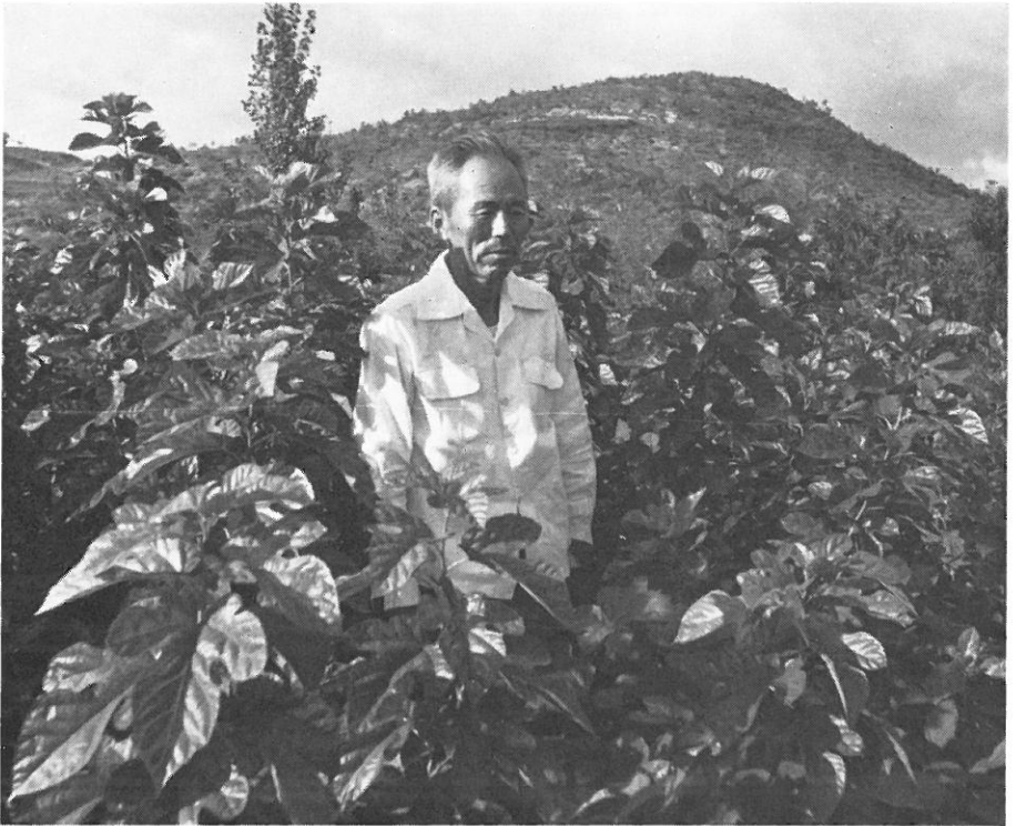
Abb. 1. Koreanischer Landwirt inmitten einer Maulbeerbaumanlage.

Es läßt sich an der Entwicklung der sechziger Jahre ablesen, welches Gewicht der Ausweitung dieses kleinbäuerlichen Betriebszweiges beige-messen wird: Im Jahre 1961 betrieben nur ca. 100 000 Haushaltungen Seidenraupenzucht und produzierten 4.865 t Kokons. Im Jahre 1970 waren es 492 000 Haushalte mit einer Produktion von 21 409 t Kokons. Waren noch 1961 23 377 Hektar Land mit Maulbeerbäumen bepflanzt, so waren es 1969 bereits 99 264 Hektar (MAF, 1971).