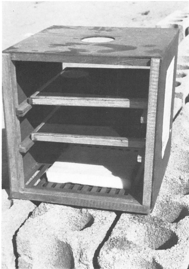
Abb. 2. Brutkasten für Seidenraupeneier.

Die Brutmenge, die ein Raupenzüchter kauft, richtet sich nach der Größe der Maulbeerbaumanlage und nach den Unterbringungsmöglichkeiten für die Raupen, die bis zum Verspinnen einen zunehmend größeren Raum benötigen. In Korea werden am häufigsten Zuchtlinien mit vier Häutungen während des Raupenstadiums gehalten. Die gekauften Eier werden in einfachen Brutkästen in etwa vier Tagen bei einer Temperatur von möglichst 25° C und 75 bis 80 % relativer Luftfeuchtigkeit ausgebrütet. Sehr kleine Mengen werden häufig in der Wohnung gehalten und aufgezogen. Manchmal befallen sich Leprakranke, die in eigenen Dörfern wohnen, mit der Aufzucht von Seidenraupen.