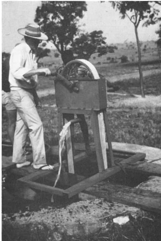
Abb. 2. Wasserhebevorrichtung „l'Africaine“ in Betrieb.

Durch das Drehen des Antriebsrades wird das Schaumgummiband in Bewegung gesetzt, ins Wasser eingetaucht und gleitet unter der untergetauchten unteren Führungsrolle durch. Diese drückt durch ihr Gewicht die Schaumgummischicht zusammen, so daß die Luft entweicht. Das Band läuft dann vollgesaugt mit Wasser nach oben und über das Antriebsrad. Dort wird wiederum durch sein Eigengewicht und das Gewicht der unteren Führungsrolle das Schaumgummiband zusammengepreßt, das geförderte Wasser herausgedrückt und im Pumpenkörper gesammelt. Eine Tergal-