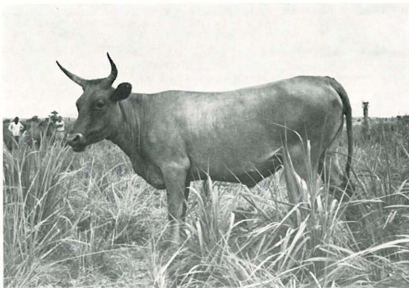
Abb. 2. Dreijähriges N'Dama Rind auf einer Weide der Ranch Lonila bei Mindouli/Rép. du Congo.

Die recht anfälligen Kreuzungsprodukte aus Montbeliard x N'Dama sind für die extensive Weidehaltung unter den natürlichen Bedingungen des Niari-Tales wenig geeignet; die Mbororo sind zwar widerstandsfähig und genügsam, liefern jedoch als große „Marschierer“ bei einem Ausschachtungsergebnis von weniger als 45 % nur eine mittlere Fleischqualität.