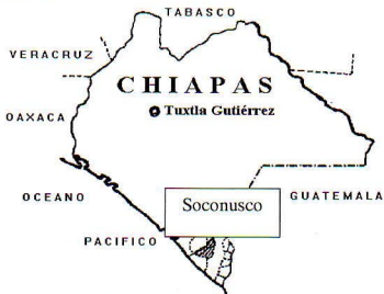
Abb. 1: Übersichtskarte Bundesstaat Chiapas

canephora ) auf 76305 ha, Mais (72000 ha), Zuckerrohr (14000 ha) und Soja (10000 ha). Der Obstanbau erfolgt auf 31500 ha. Größtes Gewicht hat der Anbau von Mango (11000 ha), Obstbananen (9000 ha), Kochbananen (4000 ha), Papaya (1500 ha) und Kaschunuß (1500 ha).