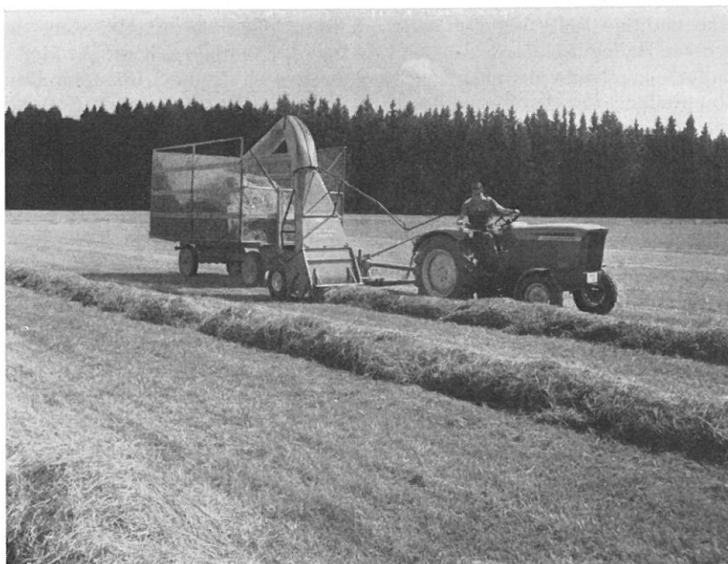
John-Deere-LANZ-Schlegelfeldhäcksler FL 140 (mit Wagen)

Eine Weidepflege auf den Naturlandstreifen ist wesentlich intensiver durchzuführen als auf extensiv bewirtschafteten Weideflächen. Es wäre aber falsch, nun alle ungenießbaren Gräser auf den Naturlandstreifen auszumerzen, in der Absicht, eine wertvollere Weide mit reinem Futtergräserbestand zu erzielen. Auch die in der Lebensgemeinschaft der Gräser vor-