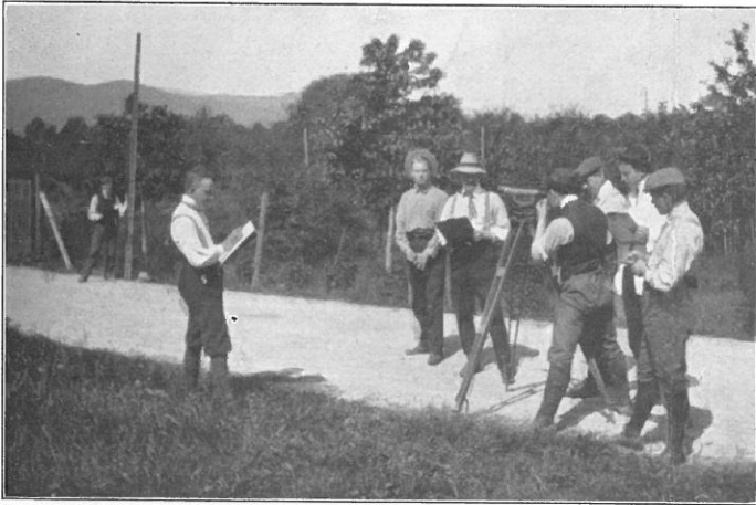
Unterricht im Feldmessen.