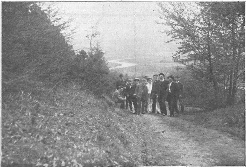
Auf einem botanischen Lehrausfluge.

Wir danken den Kameraden an dieser Stelle für das Interesse, das sie durch ihre Geschenke bewiesen haben. Da unsere Sammlungen aber noch lange nicht vollständig sind, so weisen wir immer wieder auf das Verzeichnis im „Kulturpionier“ (1905 Heft 2) hin. Der Präparierkursus geht in diesem Winter wieder seinen gewohnten Gang. Koll.