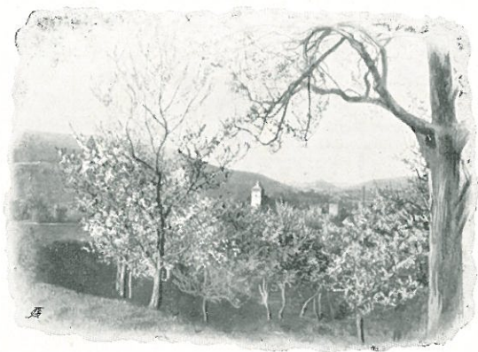
Wickenhausen in der Kirschblüte.