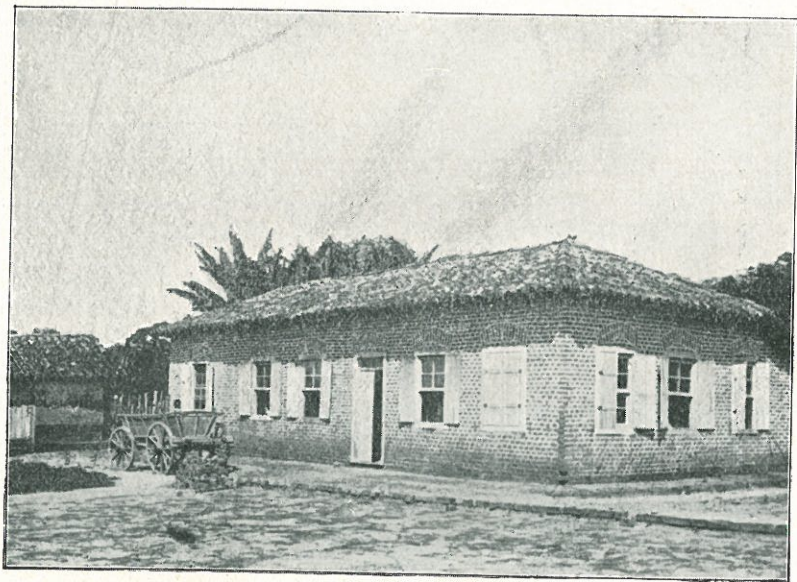
Kolonistenhaus in Friedburg (Sao Paulo).