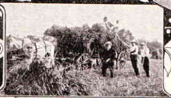
BEI DER WEIZENERNTE - ANGEBUNDEN!