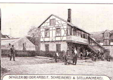
SCHÜLER BEI DER ARBEIT, SCHREINEREI & STELLMÄCHEREI.