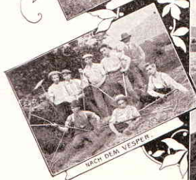
NACH DEM VESPER.