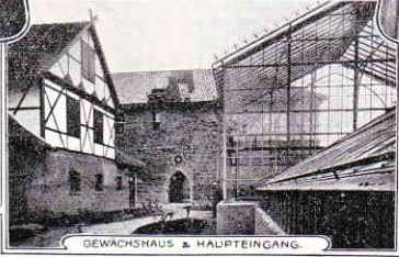
GEWACHSHAUS & HAUPT-INGANG.