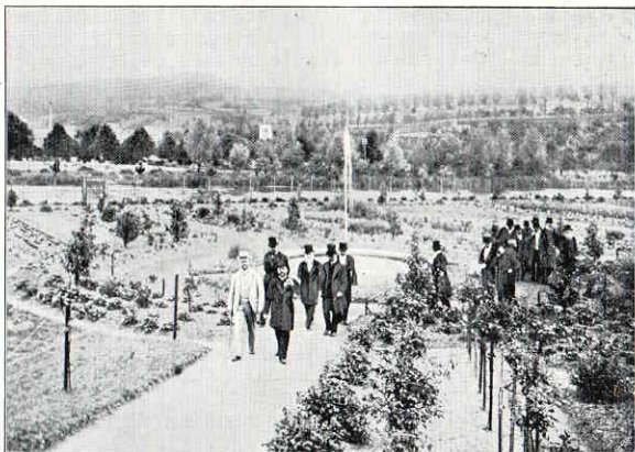
Vom Besuch Sr. Hoheit des Herzogs.