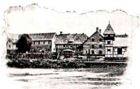
Anstalt von der Werra aus gesehen.